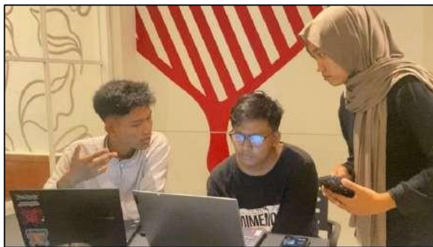
Gambar 2. Sosialisasi dan Edukasi Sederhana Pelaporan Keuangan pada UMKM

Laporan keuangan yang digunakan oleh Laku Group pada dasarnya berbentuk laporan profit and loss sederhana, yang berfungsi untuk merekap pendapatan dan biaya operasional usaha. Laporan tersebut telah mengelompokkan beberapa komponen biaya seperti biaya bahan baku, gaji karyawan, biaya utilitas, biaya pemasaran, serta cicilan usaha. Selain itu, laporan juga disusun dalam dua format yaitu laporan profit and loss secara keseluruhan serta laporan per outlet .