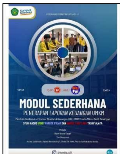
Gambar 3. Modul Sederhana Penerapan Laporan Keuangan UMKM

Penggunaan basis kas menyebabkan beberapa elemen penting dalam sistem akuntansi seperti piutang usaha, kewajiban usaha, serta penyusutan aset tetap tidak tercatat secara sistematis. Beberapa pengabdian yang telah dilakukan menunjukkan bahwa keterbatasan pemahaman akuntansi dan penggunaan sistem pencatatan manual menjadi faktor utama yang menyebabkan laporan keuangan UMKM hanya terbatas pada pencatatan kas masuk dan kas keluar tanpa penyusunan laporan keuangan yang terstruktur.