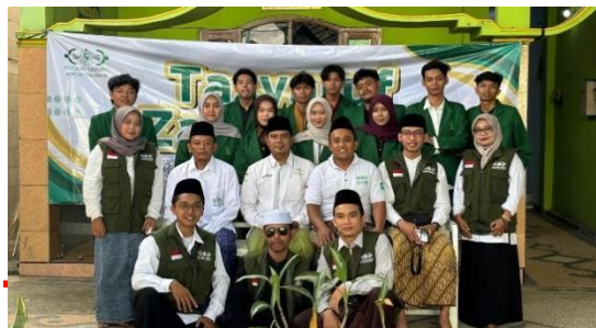
Gambar 3. Foto Tim dan Pengurus

Dokumentasi merupakan metode pengumpulan data dengan memanfaatkan beragam jenis dokumen, seperti buku acuan, sumber digital, foto, naskah, arsip, maupun rekaman (Samsinas dan Haekal 2023). Dokumentasi yang dilakukan pada penelitian ini berupa foto dan data dari NU Care LAZISNU MWCNU Prambon-Nganjuk.