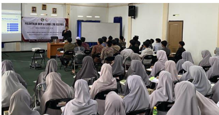
Gambar 1. Kegiatan Pengabdian dengan Memaparkan Materi

Setelah sesi edukasi, terlihat peningkatan pemahaman peserta terhadap konsep financial freedom yang lebih terstruktur ketika materi disampaikan secara sistematis dengan mengaitkan teori dasar keuangan pribadi serta contoh nyata yang relevan bagi mahasiswa. Penyampaian materi mencakup definisi financial freedom , komponen utama pengelolaan keuangan ( cash flow , budgeting , saving rate , serta strategi penciptaan passive income ), serta bagaimana konsep-konsep tersebut dapat diimplementasikan dalam kehidupan sehari-hari. Respons peserta selama sesi edukasi menunjukkan keterlibatan aktif melalui diskusi dan studi kasus, yang menunjukkan bahwa pendekatan edukatif partisipatif efektif dalam meningkatkan engagement peserta terhadap topik yang sebelumnya abstrak. Temuan ini konsisten dengan penelitian yang menunjukkan bagaimana literasi keuangan termasuk praktik budgeting dan saving berkaitan dengan perilaku keuangan mahasiswa yang lebih terencana dan berorientasi masa depan (Fawwaz & Nugraheni, 2025). Temuan ini juga sejalan dengan kegiatan pengabdian berbasis edukasi yang menunjukkan bahwa metode penyuluhan melalui ceramah dan diskusi interaktif mampu meningkatkan pemahaman serta motivasi peserta dalam mempelajari konsep-konsep akademik maupun praktis (Aminanda et al., 2024).