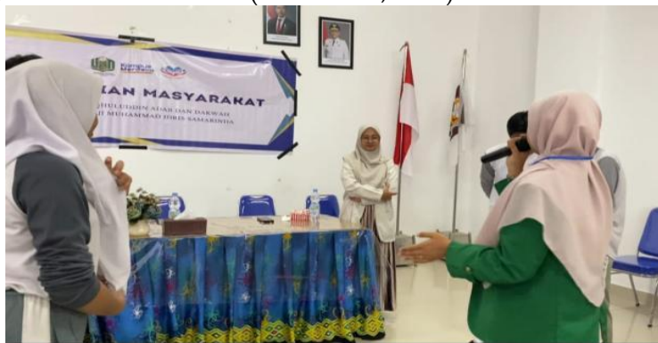
Gambar 2. Ice breaking dalam pengabdian

Rendahnya capaian siswa pada pertanyaan mengenai faktor penyebab pernikahan dini menunjukkan bahwa pemahaman mereka terhadap aspek sosial dan struktural masih terbatas, meskipun telah memahami pengertian dan dampaknya. Faktor kompleks seperti tekanan keluarga, kondisi ekonomi, serta rendahnya tingkat pendidikan dan pengetahuan belum sepenuhnya dipahami sebagai pemicu utama, padahal pemahaman ini menjadi dasar penting dalam upaya pencegahan yang efektif. Hasil sosialisasi juga mengindikasikan bahwa kegiatan tersebut berjalan dengan baik dan mampu meningkatkan kesadaran siswa SMA Negeri 14 Samarinda tentang pentingnya menunda pernikahan hingga siap secara mental, fisik, dan sosial. Secara teoretis, pernikahan dini merupakan pernikahan yang terjadi sebelum individu mencapai usia dewasa dan memiliki konsekuensi luas pada aspek sosial, ekonomi, kesehatan, dan psikologis, sehingga tidak hanya menjadi persoalan pribadi, tetapi juga menyangkut kesejahteraan masyarakat secara umum (Dewi et al., 2024).