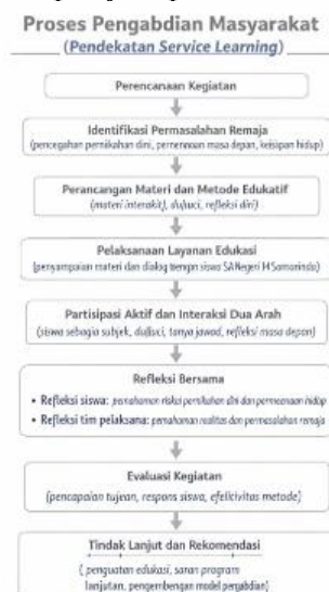
Gambar 1. Alur dan Tahapan Pelaksanaan

Sebagai bagian dari prinsip Service Learning , kegiatan ini tidak hanya menempatkan siswa sebagai penerima materi, tetapi juga sebagai subjek aktif yang diajak untuk merefleksikan perencanaan masa depan, pendidikan, dan kesiapan hidup sebelum memasuki pernikahan. Interaksi dua arah antara fasilitator dan siswa memungkinkan terjadinya proses pembelajaran sosial yang lebih bermakna dibandingkan penyampaian materi satu arah.