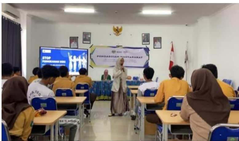
Gambar 3. Proses Pengabdian

Secara psikologis, kematangan emosi juga terkait dengan kesiapan menikah. Pada masa remaja, ketidakstabilan emosi merupakan bagian alami dari proses perkembangan yang dipengaruhi oleh perubahan fisik, hormonal, dan lingkungan sosial, sehingga remaja cenderung mudah bereaksi secara impulsif dan kurang mampu mengendalikan emosi dalam mengambil keputusan penting, termasuk keputusan untuk menikah, sebagaimana dikemukakan oleh Hurlock. Hasil sosialisasi yang menunjukkan peningkatan pemahaman siswa dapat dimaknai sebagai langkah awal dalam membantu remaja membangun kematangan emosional agar mampu mempertimbangkan risiko dan tanggung jawab secara lebih rasional. Remaja yang telah mencapai kematangan emosi diharapkan mampu menyesuaikan diri dengan baik, menjaga keharmonisan hubungan, serta berinteraksi secara positif dalam lingkungan sosialnya (Rahmawati et al., 2025).